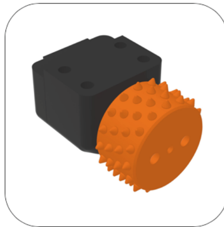
orange = mittel