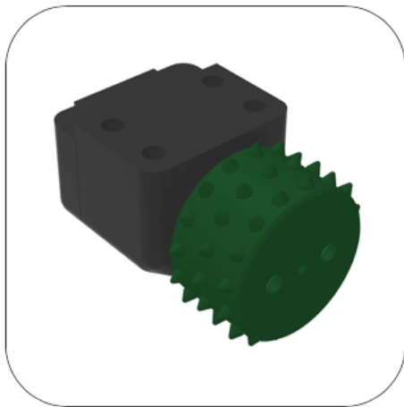
grün = grob

Drei klar abgestufte Ausführungen gewährleisten eine optimalen Anpassung an die jeweilige Anwendung bzw. das gewünschte Fräsbild.