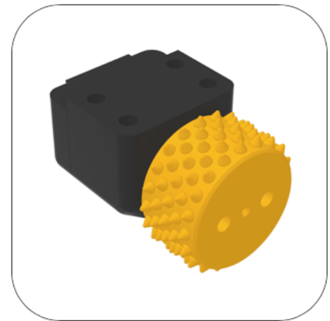
gelb = fein